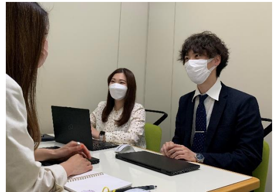
男性育休(1か月)取得社員 課長職 1児の父

くるみん認定は、時代とともに基準が更新され、近年では女性の育児サポートだけでなく、男性育休取得についての基準が設けられています。当社では、昨年度の男性育休取得者のうち、100%が1か月以上の長期取得。取得により、異なる立場の人を思いやることや、緊急時の対応力が上がり、復職後、組織のマネジメントやコミュニケーションに向上が見られます。