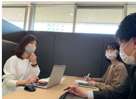
企画職 部長職 3 児の母 (左)